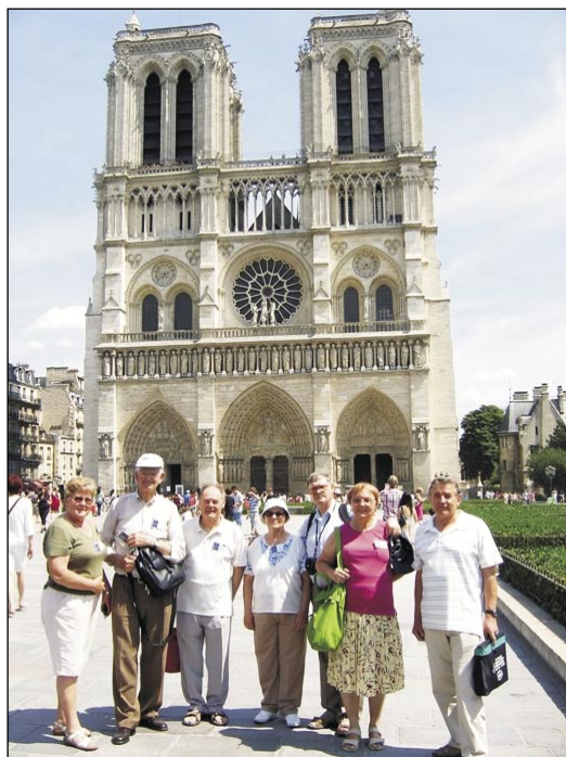
Kelkaj partoprenintoj de la 63-a IKUE-kongreso 2010 antaŭ la katedralo Notre-Dame

Pli mallarĝa ol nun, la antaŭpreĝeja placo estis superita per la tre malnova statuo de »Grand Jeuneur« (La Granda Fastanto – la sankta Johano Baptisto). Kiel diferenca estis la placo antaŭ apenaŭ 100 jaroj. La altigo de