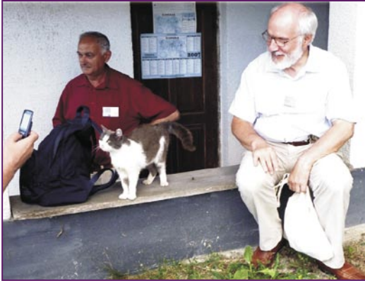
64-a IKUE-Kongreso 2011, Zagrebo, Kroatio

ter ni, ambaŭflanke. Kun niaj samlandanoj ni aktive kunlaboru kun iu laika esperantista organizo kaj en niaj reciprokaj rilatoj en internacia kampo ni ne forgesu pri la bonfaradoj. En ĉiu situacio ĉiu el ni atestu esti disponebla kaj kongrua persono kun propraj kristanaj principoj.