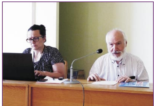
En la 69-a kongreso de IKUE 2016 en la urbo Nitra, Slovakio