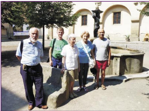
Kun italaj kongresanoj en la 22-a Ekumena E-Kongreso 2018 en la urbo Poděbrady, Ĉeĥio

d) Uzo de Esperanto: ĝi estas la instrumento de nia laboro; ni devas profundigi nian scion de ĝi, ĉiam zorgi por esti pretaj uzi ĝin,