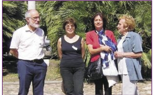
Dum Kongreso de U.E.C.I en Rimini 2003

Jen mi. Mi estas la nova prezidanto de UECI. Koscia pri miaj limoj, mi akceptis ĉi tiun taskon per iom da senprudenteco, sed iu devis ja prizorgi ĝin kaj pro la insistado de tiom da amikoj mi estas konvinkigita. Miaj limoj, kiuj markas la diferencon al mia antaŭulo, estas baze ĉi tiuj du: