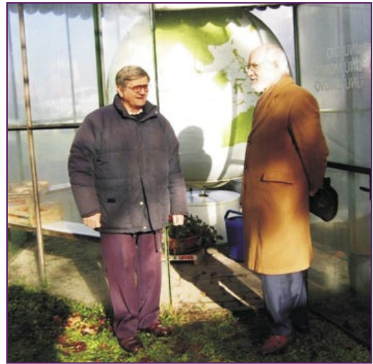
En la Ĝardeno Esperanto de Conti

Mi dankas vin plue pro la grandega laboro, kiun vi faris, ĉu kiel prezidanto de