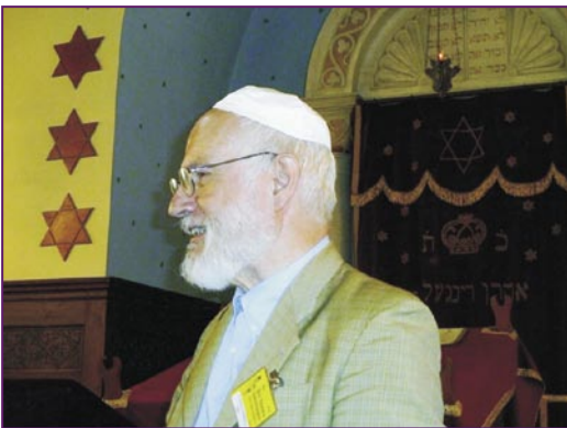
20-a EEK 2014 - vizito de sinagogo en Merano