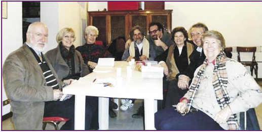
En la Esperanto-Centro de Milano