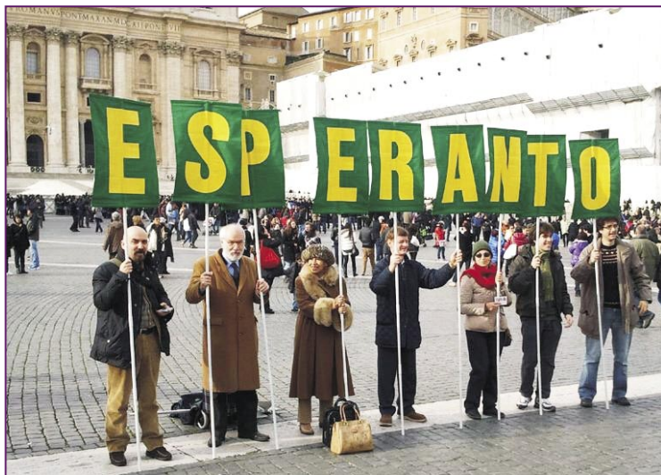
Plurfoje sur la Placo Sankta Petro en Vatikano dum mesaĝoj de la papo Urbi et Orbi (al urbo kaj mondo)

GD. Sincere mi konfesas, ke multaj aspektoj de la vivo de Internacia Katolika Unuiĝo Esperantista estas por ni nekonataj. Kial do mi akceptis kandidatiĝi por ĉi tiu tasko? La insistado de kelkaj samideanoj, kiuj firme kaj afable petis tion, konvinkis min. Eble mi ne estas la plej taŭga persono – pri tio mi konscias – sed devas esti ja iu, kiu surprenas ĉi tiun ŝarĝon. Tamen, mi konfidas en la dia helpo, ĉar ni scias, ke Li por realigi siajn projektojn elektas plej ofte la ŝajne malplej dignajn, por ke ili estu simpla ilo en Liaj manoj.