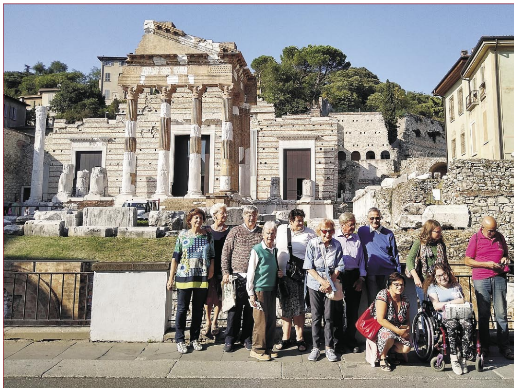
La italaj katolikaj esperantistoj kongresis en la urbo Brescia

Ho Sankta Paŭlo la Sesa, filo de nia tero, disĉiplo de Kristo en la fido, paŝtisto de la Eklezio, sankta antaŭ Dio kaj la homoj, ni alvokas kun ĝojo vian protekton. Vi, nun en la plena lumo de Dio, daŭrigu propeti por la Eklezio en ĝia misio. Havigu al ni, ankoraŭ pilgrimantoj, la gracojn necesajn por sekvi Jesuon Kriston, ununuran Savanton de la mondo.