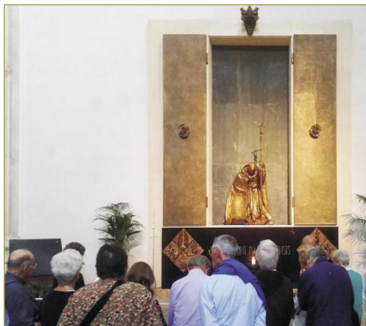
La preĝon en la katedralo de Brescia apud la altaro de la sankta papo Paŭlo la Sesaj tie preĝis la kongresanoj

Post la meso ankaŭ okazis vizito de la fama preĝejo de la sankta Francisko de Asizo, apud kiu troviĝas la monaĥejo de la