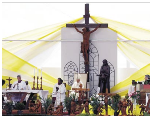
La papo Francisko en Madagaskaro

al ĝenerala bono. Kaj mi instigis gejunulojn apartenantajn al diversaj religioj, por ke ili konstruu sian patrujon per supero de rezignacio kaj senpacienco, per kultivado de sociala afableco kaj respekto rilate al tradicioj de pli maljunaj. Al episkopoj, sacerdotoj kaj konsekritaj personoj, kun kiuj mi renkontiĝis en la katedralo de Maputo, konsekrita al la Senmakula Koncipiĝo, mi proponis ŝian nazaretan vojdon de la grandanima jesado al Dio en dankema rememorado pri Lia alvokiĝo kaj propra deveno. Forta evangelia signo estas Hospitalo en Zimpeto, en periferio de la ĉefurbo, kiu estis konstruita klopode de la Komunumo Sant'Egidio. En tiu ĉi hospitalo mi vidis, kiel malsanuloj estas tiuj la plej gravaj. Pri ili insertis ĉiuj. Ne ĉiu el ili estas de la sama religio. Direktorino de la hospitalo estas eminenta virino, scienca laborulino kaj mahometanino. Ĉiuj tie kune laboras por popolo, en unueco kiel fratoj. Mia vizito de Mozambiko kulminis per la sankta meso sur stadiono. Pluvis, sed ĉiuj ni estis feliĉaj. Kantoj, spiritaj dancoj, feliĉo.