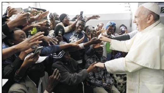
La papo Francisko en Mozambiko

Hieraŭ mi revenis el la apostola vojaĝo al Mozambiko, Madagaskaro kaj Maŭricio. Mi dankas al Dio, kiu al mi ebligis realigi tiun ĉi pilgrimon de la paco kaj espero, kaj denove mi esprimas dankemon al reprezentantoj de la unuopaj ŝtatoj, kiel ankaŭ al episkoparoj, kiuj min tiel kore invitis kaj zorgeme akceptis, kaj ankaŭ al la apostolaj nuncioj, kiuj tiun ĉi vojaĝon preparis.