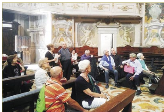
En Santa Maria della Carita e del Buon pastore