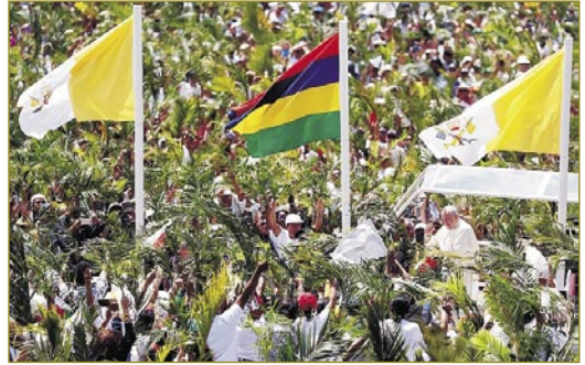
La papo Francisko en Maŭrcio

interreligia dialogo kaj ankaŭ amikeco inter reprezentantoj de la apartaj religiaj konfesioj. Al ni tio povus ŝajni nenormala, sed tie vivata amikeco estas tute natura. Kiam mi venis al episkopejo mi tie trovis belegan florbukedon de la tiea supera imamo kiel signon de la frateco.