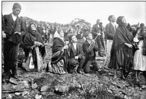
La homamaso observanta sunmiraklon

temis? Kiam la Sinjorino instigis la viziulojn pri oferoj por pekuloj, tiam unu radio el ŝiaj manplatoj penetris kvazaŭ en la teron kaj malkovris por iliaj okuloj inferon. La infanoj vidis neestingeblan fajran maron kaj en ĝi ŝvebantajn, terure aspektantajn