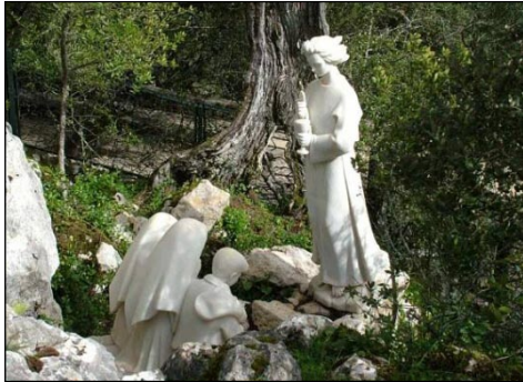
Loko de la aperoj de la anĝelo

sinjorino. Tiu mansignis kaj trankviligis ilin per vortoj: „Ne timu, mi ne malutilos vin.“ La infana grupeto rigardis ĉi tiun fenomenon kun vera mirego. Nur Lucia kuraĝis demandi: „De kie vi estas?“ „Mia patrujo estas la ĉielo,“ respondis la misterplena virino kaj eksplikis kialon de ŝia apero. „Mi alvenis por peti vin ke vi venu ĉi tien sesfoje