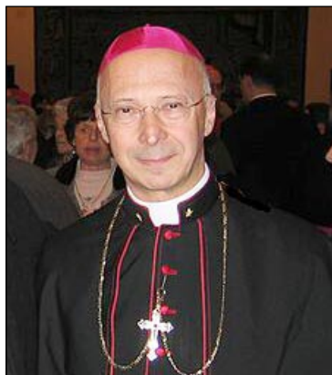
Kardinalo Angelo Bagnasco

La raporto de la Observatorio de la kardinalo Van Thuân proponas kiel elirsolvon malpezigitan institucian formon de la Eŭropa Unio, pli profundan ekkonscion de la propra identeco kaj pli grandan respekton al tio,