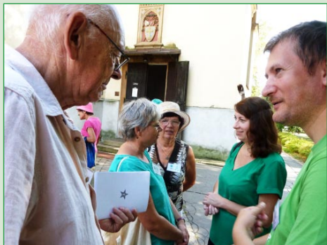
Interbabilado antaŭ preĝejo en Poděbrady