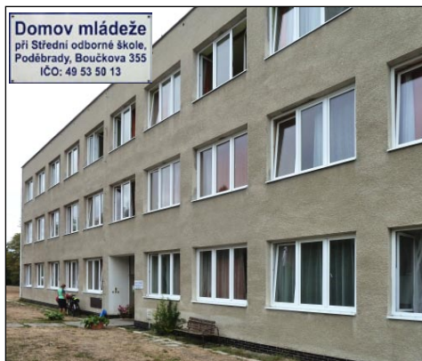
Domov mládeže při Střední odborné škole, Poděbrady, Boučková 355 IČO: 49 53 50 13