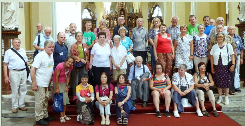
Parto de la kongresanoj vizitintaj la katedralon en Kutná Hora - Sedlec