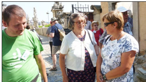
Dumvizite en Kutná Hora

Kaj vespere okazis interkona vespero finita per preĝo.