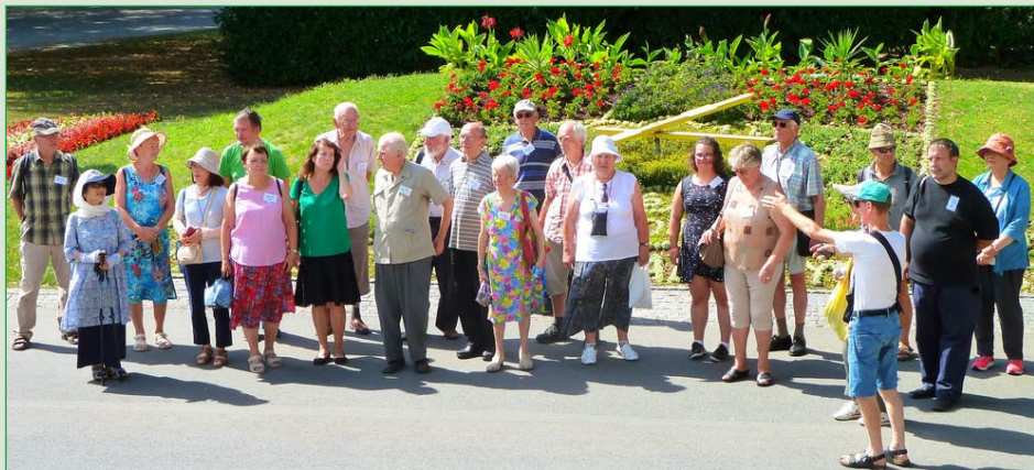
Grupo de la kongresanaro dum trarigardo de la urbo Poděbrady