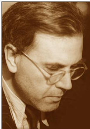
Dietrich von Hildebrand (12.10.1889-26.1.1977)

Ne povas esti dubo pri tio, ke la akceptado de la sankta komunio sur la manon estas esprimo de perdo de la senco pri sankteco en la Eklezio ĝenerale, kaj pri manko precipe de la respekto al la Eŭkaristio. Nesprimebla mistero de la vera ĉeestado de Kristo en transsubstanciĝinta hostio postulas profundan pian starpunkton de la plen-