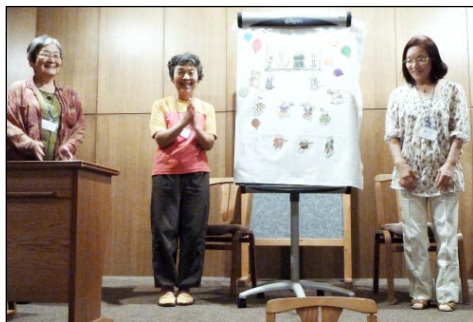
Japaninoj prezentas sian programeron