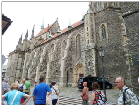
Alveno al Kolín, kie okazis la sankta meso

Merkredon post la matena preĝo kaj matenmanĝo okazis tuttaga busekskurso denove en du grupoj. Tiuj, kiuj volis partopreni la sanktan meson, tiuj unue vizitis la urbon Kutná Hora kun la fama preĝejo de sankta Barbara, poste preĝejon de sankta Jakobo, sekvis vizito de la preĝejo de Ĉielenpreno de la Virgulino Maria kaj de la sankta Johano Baptisto en Sedlec kaj de Ostejo en Sedlec.