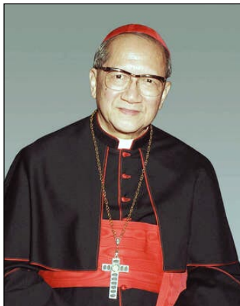
La fondinto kardinalo Van Thuân

Italio. Eŭropo estas konsumiĝanta per laciĝo kaj tre malproksimiĝanta de siaj originaj idealoj. Eŭropo, kiu senreviĝis el iluzioj. Platigita kaj baraktiĝanta kontinento, loĝigita de senkolora socio sen bonodoro kaj fetoro, kiu taŭgiĝis al ununura, uniforma pensado. Tiun ĉi tute senkompatan bildon de nia kontinento priskribas la naŭa raporto pri la stato de la sociala instruo de la katolika eklezio en la mondo, kiun en Romo prezentis Observatorio de la Socia Instruo de la Kardinalo Van Thuân, aganta en norditalia