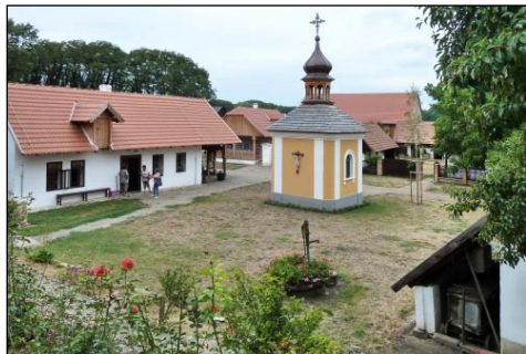
Etnografia muzeo en Přerov nad Labem

partopreni la katolikan E-meson, tiuj unue vizitis la urbon Přerov nad Labem – Polabské národopisné muzeum – Elboregionan etnografian muzeon kaj post ĝi la urbon Lysá nad Labem, kie en la preĝejo de la Naskiĝo de Johano la Baptisto okazis la esperantlingva sankta meso.