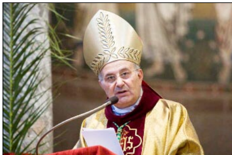
Ĉefepiskopo Giampaolo Crepaldi

Kvankam la nocio “krizo” dum lastaj jaroj cedas al inflacio, laŭ la aŭtoroj de la raporto, en kiu partumis kvin internaciaj esploraj centroj (Madrido, Vroclavo, Peruo, Argentino, Ekvadoro kaj la roma Centrejo de Studoj Rosaria Livatina), plej trafte