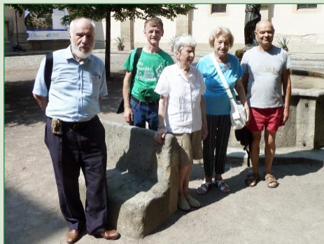
Kongresa grupeto de la italaj IKUE-anoj