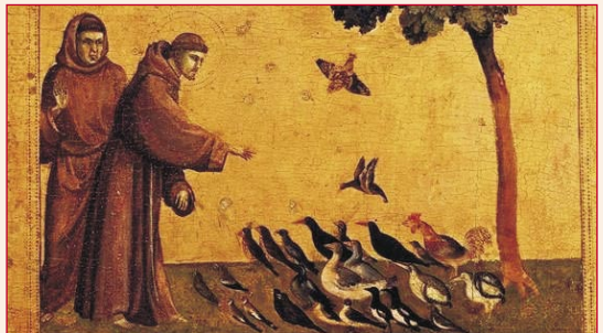
Giotto Di Bondobe: sankta Francisko