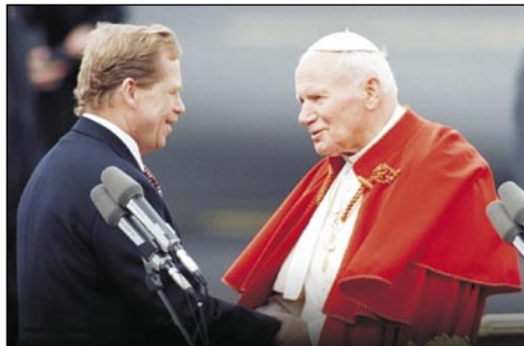
La prezidento Václav Havel bonvenigas la papon Johanon Paŭlon la Duan en Prago

La 19-an de marto 1985 Johano Paŭlo la Dua subskribis la leteron por animpaŝtistoj de Ĉeĥoslovakio, rememorigante la sanktu-