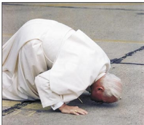
La papo post alveno kisas la ĉeĥan teron

La pilgrimantoj el Ĉeĥoslovakio, kiuj unuafoje ricevis de la regantoj la permeson por la pilgrimo al Romo, dum la papa aŭdi-