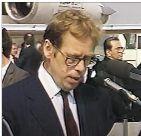
Bonveniga alparolo de la prezidento Havel

raklo. Malgraŭ tio mi kuraĝas diri, ke hodiaŭ posttagmeze mi estos la partoprenanto de la miraklo: Sur la loko, kie antaŭ kvin monatoj, en la tago, kiam ni ĝojis pro la kanonizado de la Agnesa Ĉeĥa, estis decidite pri la estonteco de nia lando, la pontifiko de la katolika eklezio hodiaŭ celebros la sanktan meson kaj verŝajne li dankegos al nia sanktulino Agnesa por la propeto ĉe Tiu, kiu tenadas en siaj manoj la misteran pasadon de ĉiuj eventoj.