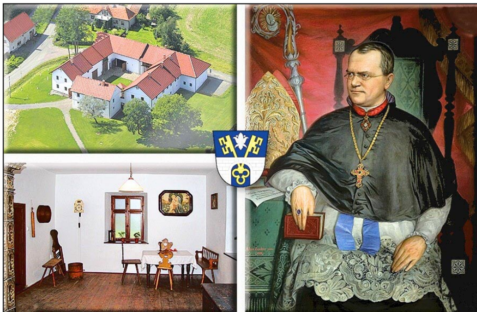
La domo, en kiu naskiĝis la 20.7.1822 en la vilaĝo Hynčice Johano Gregorio Mendel