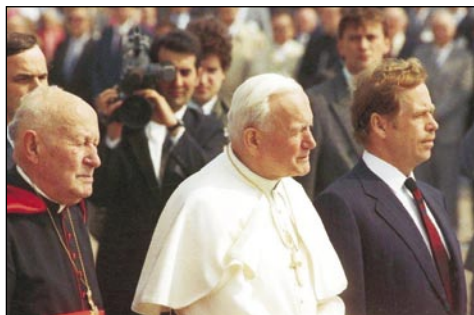
Kard. F. Tomášek, la papo kaj V. Havel

enco en Aŭlo de Paŭlo la Sesa aŭdigis la ĝojkrion: „Papež musí do Prahy!“ (La papo devas en Pragon!). La Sankta Patro respondis ŝerceme: „Jak tylo mnie wpuścicie“ (Nur kiam vi min enlasos).