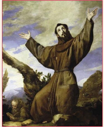
Jusepe de Ribera: s-ta Francisko

Laŭdu kaj benu mian Sinjoron, kaj danku kaj honoru Lin kun granda humileco.