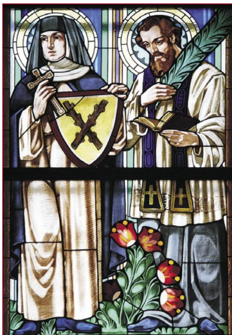
Sanktaj Zdislava kaj Johano Sarkander