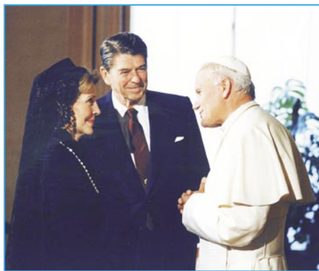
La papo Johano Paŭlo la Dua kaj ŝtata prezidento de Usono Ronald Reagan kun edzino la 7.6.1982

Usono, oni ne povas ne rimarki, ke la eĥo de lia alparolo en la sidejo de UNO eksonis en ĉiu el ĉeestantoj. Esprimante al usonanoj la rekonon por la sindonemo al demokratio, Johano Paŭlo la Dua konsekvence kritikis materialismon, konsumadon kaj egoismon. „La minaco por la familia vivo estas socio, por kiu la fetiĉo estas plezuro, oportuno kaj sendependeco. Tamen ĉio tio rezultigis el tio, ke homaj koroj fermiĝas en sin mem kaj estiĝas egoismemaj“ – diris la Papo dum la lasta sankta meso en Vaŝingtono. La kuriozaĵo de ĉi tiu pilgrimo estis la fakto, ke