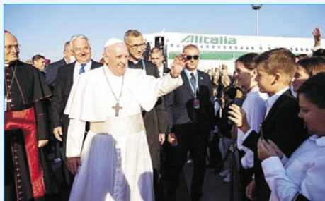
Alveno al Budapeŝto 12.9.2021