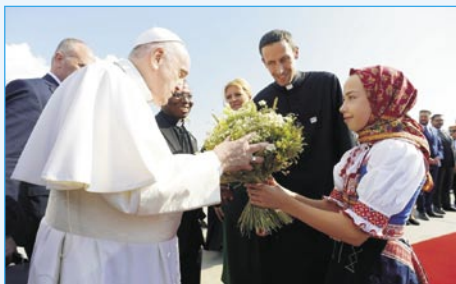
Bonvenigo en Bratislava