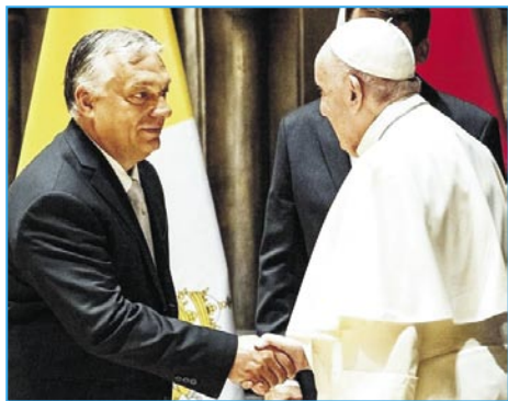
Renkontiĝo kun premiero Viktor Orbán

La papo Francisko realigis animzorgan viziton de Hungario kaj Slovakio. En Hungario li partoprenis la sanktan meson okazintan fine de la Internacia Eŭkaristia Kongreso en la hungaria ĉefurbo Budapeŝto antaŭtagmeze la 12-an de septembro.