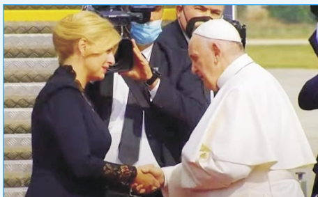
Adiaŭo kun la ŝtatprezidentino 15.9.2021