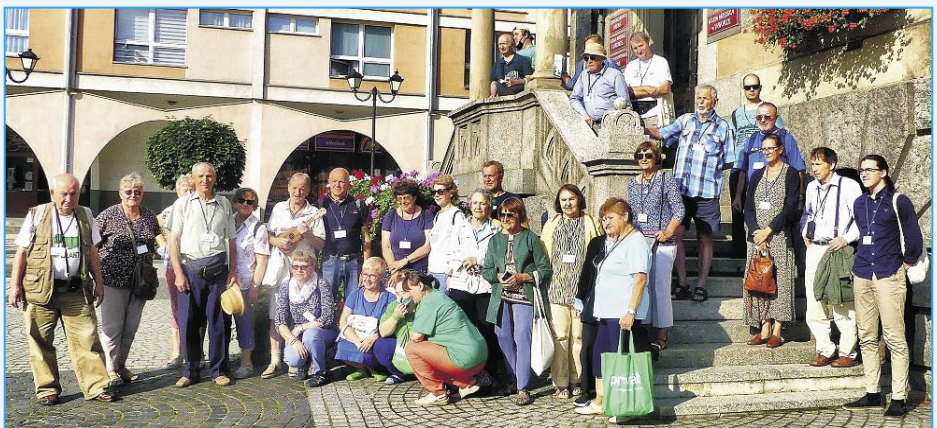
La kongresanoj ekskursantaj en la urbo Jawor