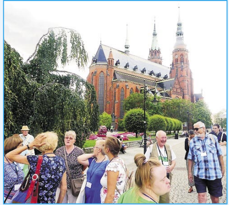
Trarigardo de la kongresurbo Legnica