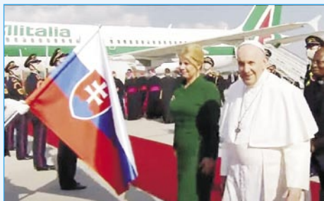
Post alveno al Bratislava 12.9.2021