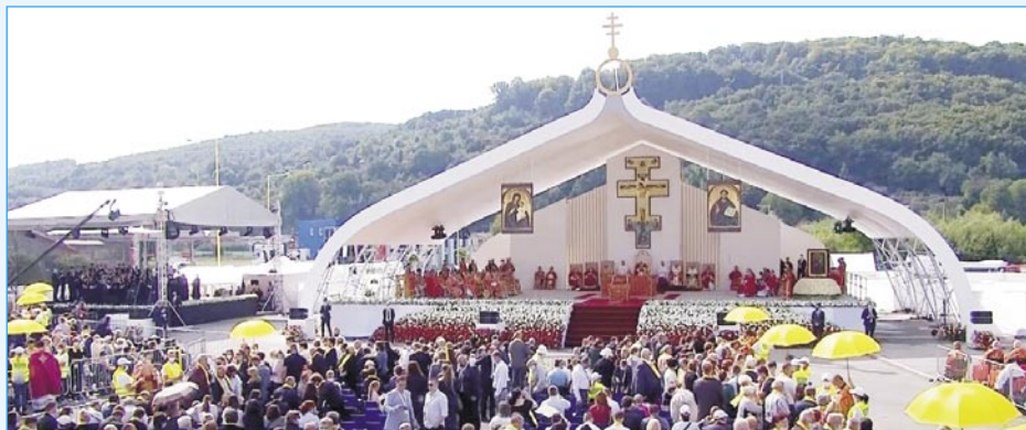
Slovakio: Dia liturgio de s-ta Johano la Orbuŝa en Prešov 14.9.2021