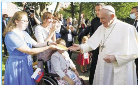
La papo en centrojo Betlehem