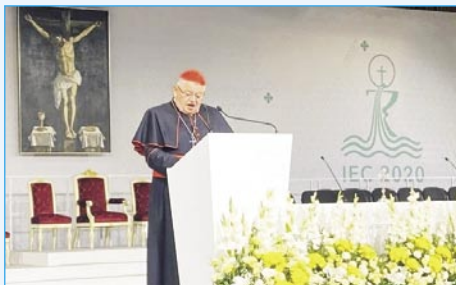
Kardinalo Dominik Duka en Budapeŝto