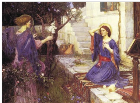
John William Waterhouse - La Anunĉiaco

ere la demokratio fariĝas, kontraŭ siaj propraj principoj, certa formo de totalismo“ ( Evangelium vitae , 20).